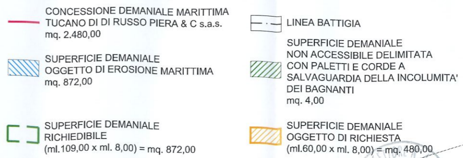
PLANIMETRIA GENERALE scala 1:500